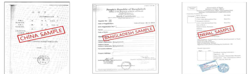
가족 관계 증명서 Family Relationship Certificate