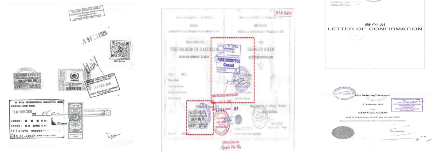
파키스탄 Pakistan 베트남 Viet Nam 스리랑카 Sri Lanka