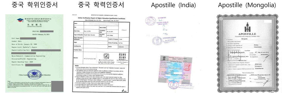
대사관 학위 증명서 인증서 Verification of diploma from Korean Embassy